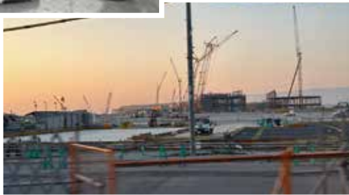
整備が進む万博会場