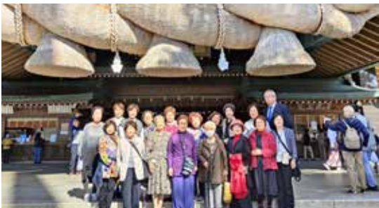
有名な「大注連縄」の前で集合写真（神楽殿にて）