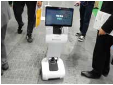
開催支援EXPOにて最新技術を先取り

開催支援EXPOでは様々な企業の最新技術や万博で実際に発表されるであろう未来技術などが展示されていました。また、大阪府咲洲庁舎では万博の構想や発表されるであろう未来技術などを聞いた上で、当万博への期待、工事費用高騰への懸念や捻出等について意見交換がなされた後、実際の工事現場を上から眺める事ができ、構想との比較や今後の工事の進捗を楽しむことができました。最後に名家「華中華」にて部会員同士の懇親を深める事ができ、大変有意義な見学会となりました。