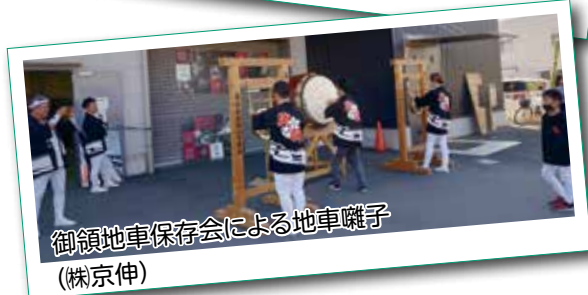
御領地車保存会による地車囃子 (株京伸)