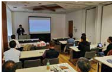
指定管理者制度の経営方針を学びました