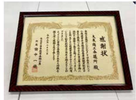
感謝状をいただきました