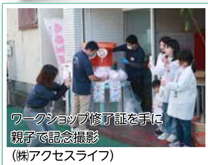
ワークショップ修了証を手に 親子で記念撮影