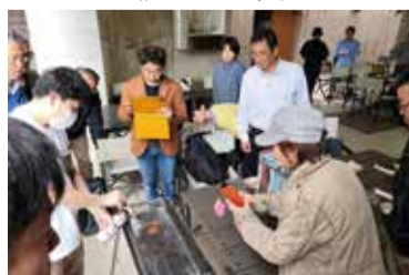
簡単に火起こしできます