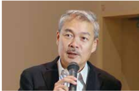
藤井 聡氏による講演