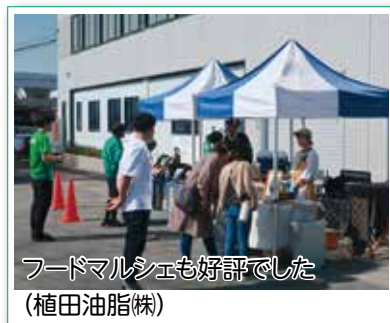
フードマルシェも好評でした (植田油脂株)