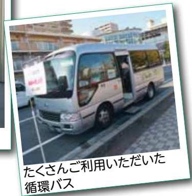
たくさんご利用いただいた 循環バス