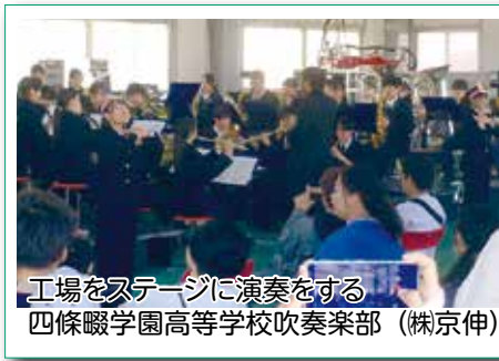
工場をステージに演奏をする 四條畷学園高等学校吹奏楽部 (株京伸)