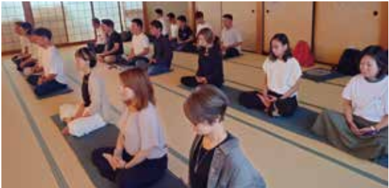
自分の心と向き合う時間となりました