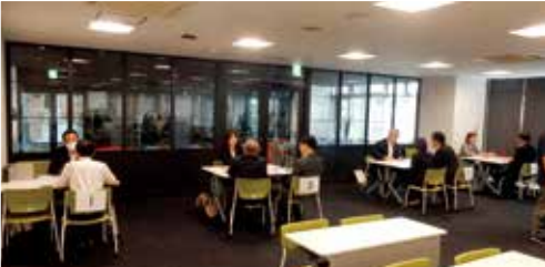
企業担当者とは就職サポート担当者による情報交換の様子