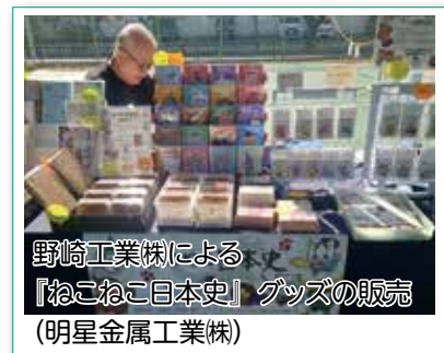
野崎工業株による 『ねこねこ日本史』グッズの販売 (明星金属工業株)