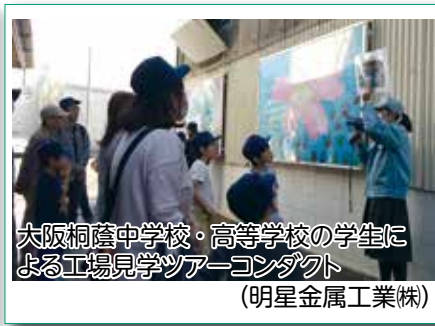
大阪桐蔭中学校・高等学校の学生による工場見学ツアーコンダクト (明星金属工業株)