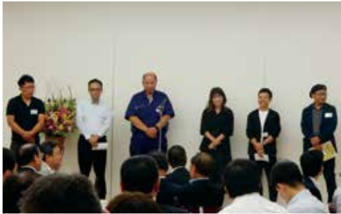
60秒PRスピーチをする新入会員の皆様

その後交流会が開催され、今年度にご入会いただいた事業者を対象とした新入会員歓迎会にて、組織活性化委員会主導のもと60秒PRスピーチを行っていただきました。そして、参加者での名刺交換を行うとともに、異業種の事業者と交流・情報交換をしていただきました。