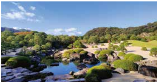
「絵画のような庭園」足立美術館の庭園より

その後は、縁結びの神様で知られる「出雲大社」へ。旧暦の10月は地元では「神在月（かみありつき）」と呼ばれ、日本中の神様が立ち寄られる特別な時季であり、今回の参拝は、一層、気持ちのよい秋晴れと相まって清々しい気分になりました。18名の参加者全員が、玉造温泉にも堪能しつつ、楽しい宴と相まって、より親睦を深めることができました。