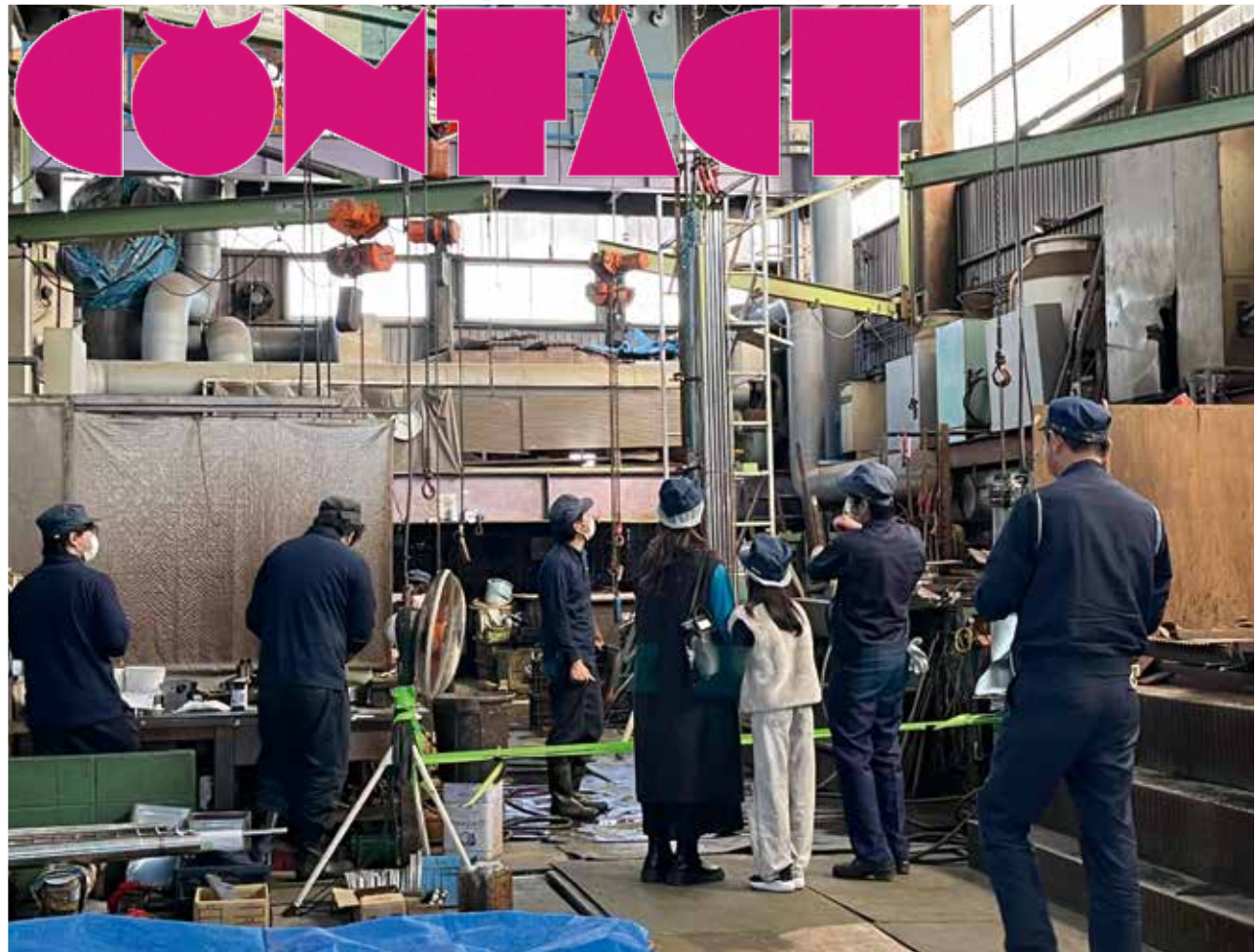
ものづくり企業で使われる機械を、劣化やサビ、摩耗から守る「メッキ加工技術」を見学（株式会社 生駒）