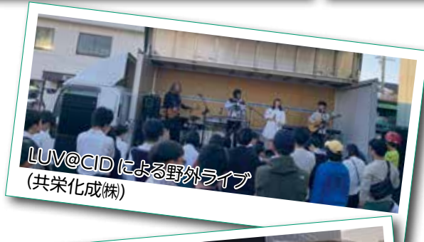
LUV@CIDによる野外ライブ (共栄化成株)