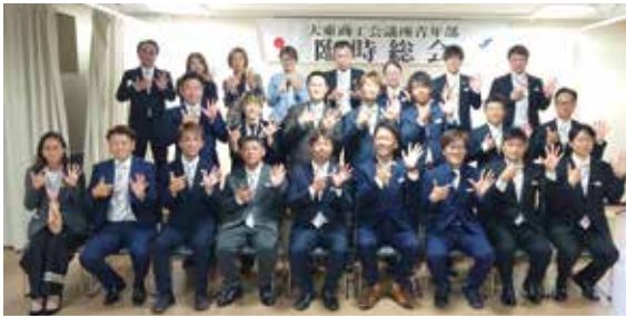
25周年ポーズで集合写真