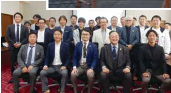
大阪府と意見交換後の集合写真