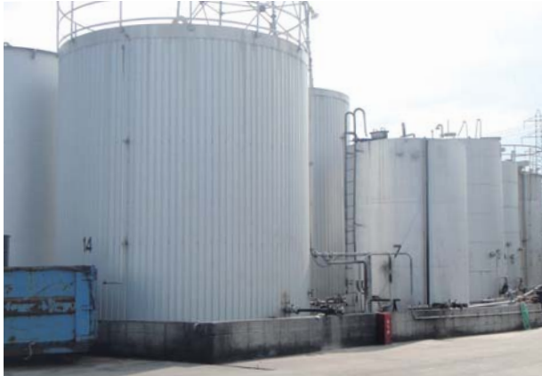
約 800t 保管できるタンクヤード