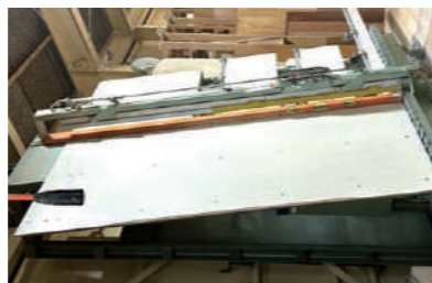
写真-4 ※写真は 90°反転