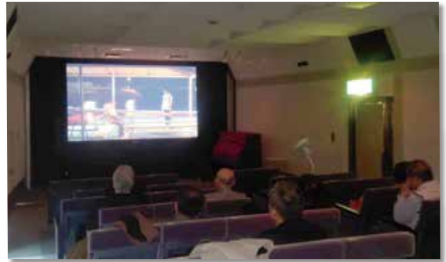
住道駅高架下にある48席のミニシアター