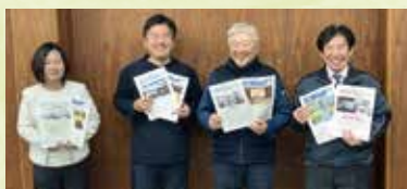
「チェンバーだいとう」を これからもよろしくお願いいたします。 （広報委員会）