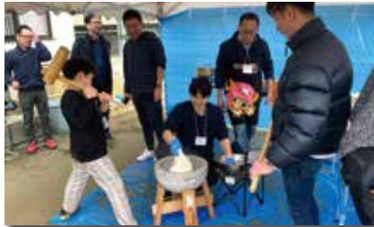
杵と臼を使っての餅つき

餅つきの他に日本の伝統的遊びである福笑いや羽子板などを体験したほか、今年目標を実行するためにもマンダラチャートの体験をしました。