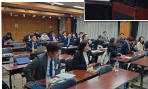
真剣に話を聞く参加メンバー