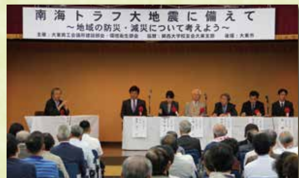
建設部会・環境衛生部会主催 防災・減災基調講演会「南海トラフ大地震に備えて」（平成 25 年）