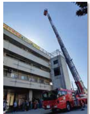
35mまで届くはしご車 価格は2億円!