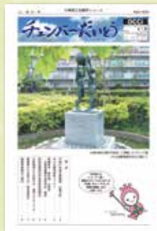
フルカラーにリニューアル 写真：市政 50 周年を記念して 寄贈されたブロンズ像（平成 21 年）