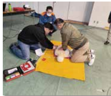
成人の胸骨部分なら「5cm!!」 押さえることが必要