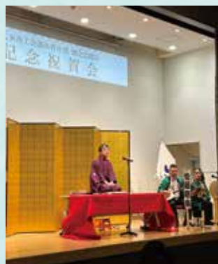
落語「のぞきまいり」