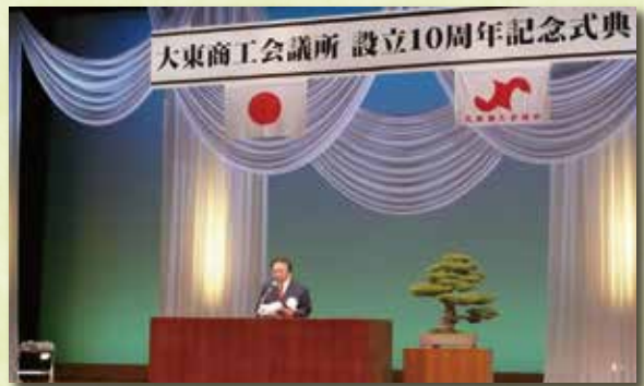
設立 10 周年記念式典（平成 20 年）