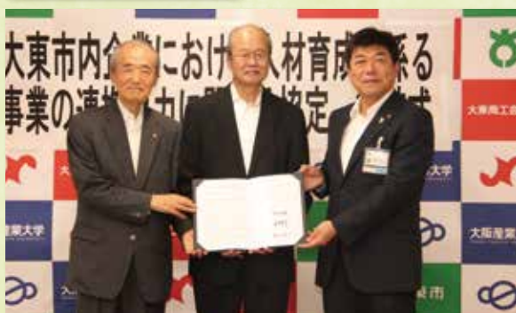
大阪産業大学・大東市との人材育成事業協定（平成30年）