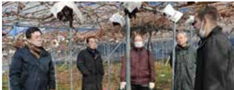
ドイツ出身の従業員が特徴を熱弁してくれました