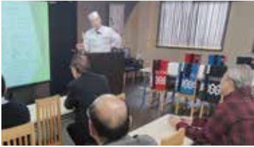
新たな事業の立ち上げのコツを学びました

訪日外国人を対象にした体験事業等で著名な寿司店(株)梅守本店(奈良市)を訪問。地域の牛乳店が現在の業態に至るまでの様々な経験を通じ「事業立ち上げのコツ」等をテーマに感情豊かに講演して頂きました。また帰路では、地域が誇る河内ワインをつくる「カタシモワイナリー(柏原市)」を視察し「地域が元気になる」ヒントを見つけるきっかけとなりました。