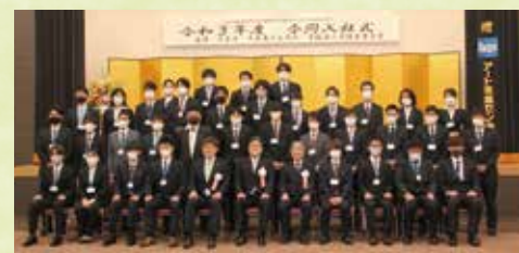
『DAITO DOUKI CAMPUS』合同入社式（令和3年）

令和5年 ・だいとうオープンファクトリー CONTACT 初開催（148号） 『阪神タイガース38年ぶりの「A.R.E.」 （日本一）を達成』