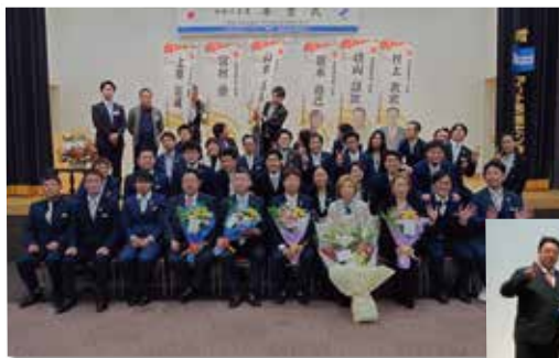
卒業生に卒業証書と記念品を授与

今回は3名のオブザーバーが参加されましたが、3名とも入会していただく事が出来ました。令和5年の事業もこれで終わりとなりますが、引続き令和6年度もよろしくお願いいたします。