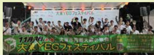
大東 YEG フェスティバル（令和4年）