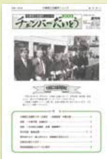
創刊号（平成 11 年） 会館前でテープカット