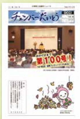
チェンバーだいとう 100号 表紙：辛坊治郎氏による 講演会（平成27年）