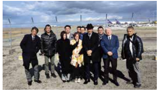
大迫力の飛行機のエンジン音でした

24時間空港のメリットを活かし、国内有数の貨物取扱量を誇る国際貨物地区など普段立ち入る事ができないエリアを見学出来ました。さらに滑走路横でバスを横付けし、迫力ある飛行機の着陸見学、ターミナル内では、訪日外国人観光客等による想像を超える盛況に「特別な体験が出来た」と参加者全員が述べていました。