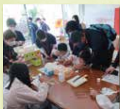
だいとうオープン ファクトリー CONTACT （令和5年）