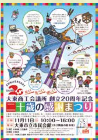
創立20周年記念事業 「二十歳の感謝まつり」 （平成30年）