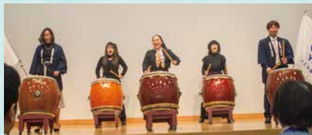
太鼓の演奏で開幕