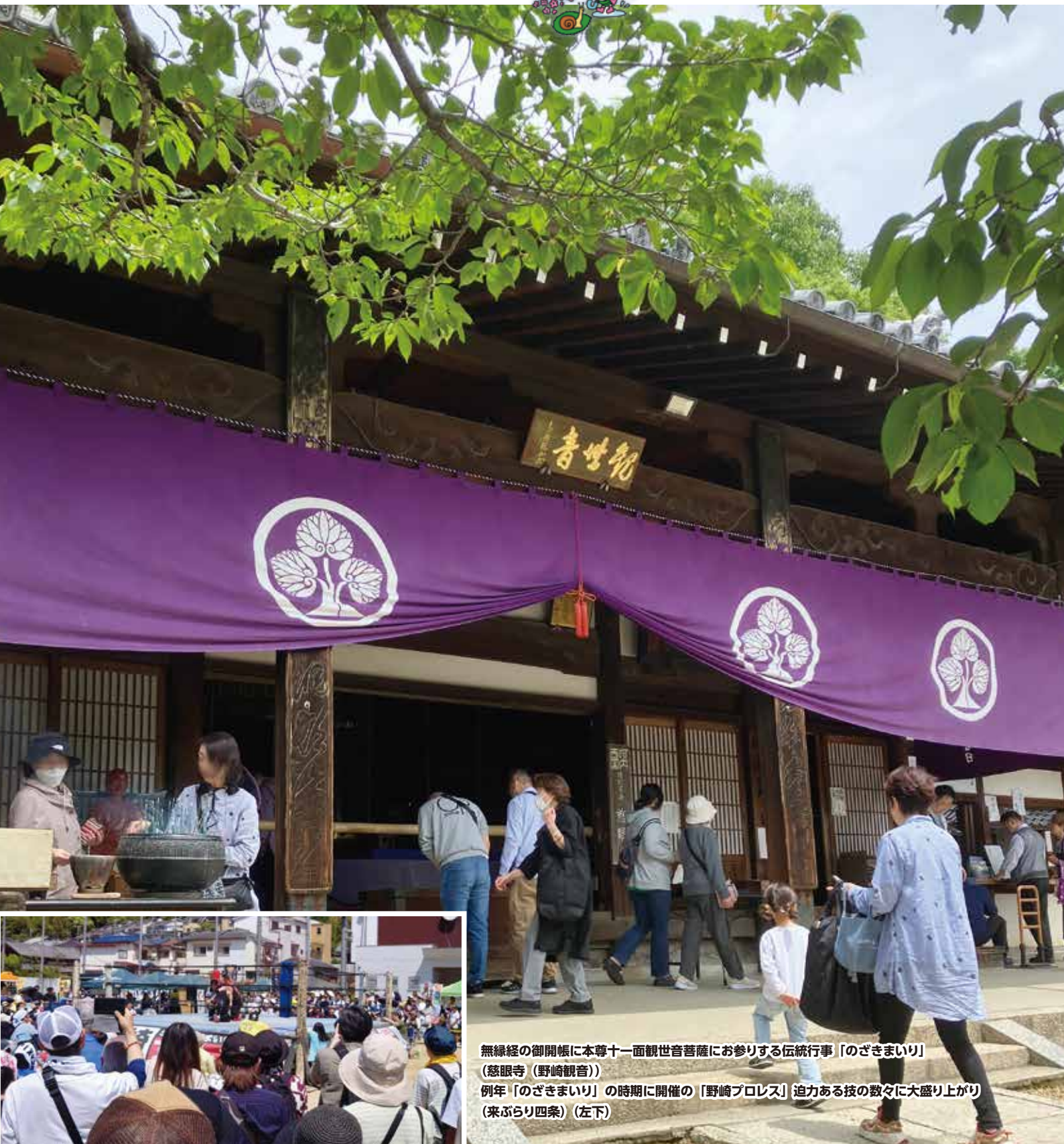
無縁経の御開帳に本尊十一面観世音菩薩にお参りする伝統行事「のぎきまいり」 (慈眼寺 (野崎観音))