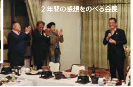
2年間の感想をのべる会長