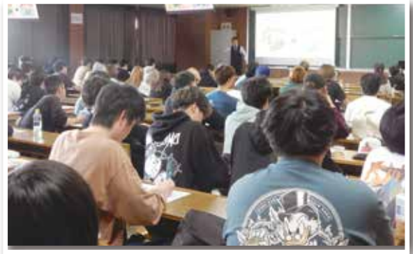
講義に耳を傾ける学生の皆様

学生の皆様におかれましては、講義中の質疑応答やご記入いただいたコメントから、様々な業界への見聞を広め、企業を取り巻く環境を把握する機会として、本講義へ臨まれた様子が伺えました。