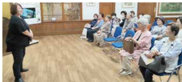
創業者の思いを熱く語って頂きました