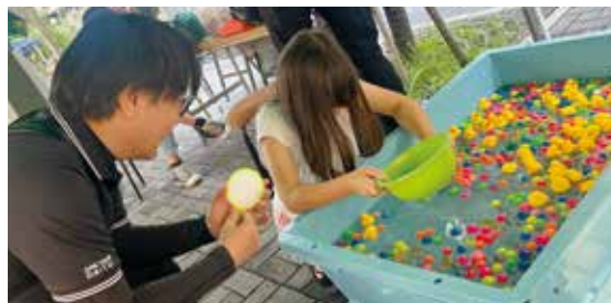
スーパーボールすくいは今年も登場