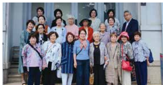
グンゼ綾部本社前にて