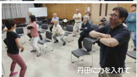
丹田に力を入れて