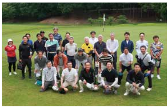
スタート前に集合写真

表彰式では、事業所より頂いた協賛品など多くの方々へ賞品が贈られ、非常に盛り上がった一日となりました。