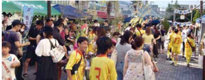
暑い中でしたが多くの来場者で賑わう