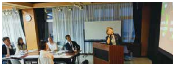
動画・チラシ・歌？ 色んな紹介がありました