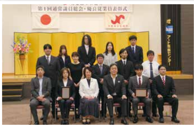
受賞者で集合写真 (優良従業員表彰式にて)