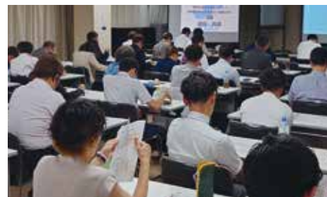
神妙な面持ちで講義を受ける

参加者からは「未来の資産形成について役立つと思う」「なかなか決算書の見方の講習を受けられる場がなかったので受けられてよかった」などの感想が聞かれました。