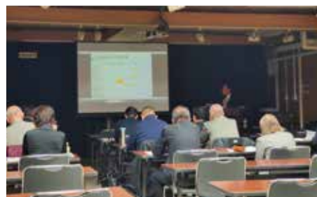
自社の未来を見据え、真剣に聞き入るメンバー