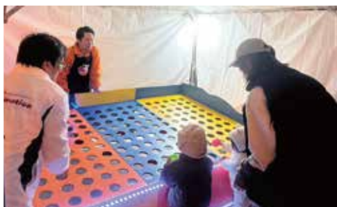
大人気!奇跡の一投

11月29日(土)、住道駅前デッキで大東市スマイルミネーション点灯式が開催され青年部は恒例の「トマ豚汁」と縁日屋台「奇跡の一投」を出店しました。今年度は夕方からの出店となりましたが、寒さも相まってかトマ豚汁は168食が完売、「奇跡の一投」も景品がすべてなくなる盛況ぶりでした。会場ではスマイルウエディングやダンス、体験型イルミネーションなど多彩な催しが行われ、子どもから大人まで多くの来場者に楽しんでいただき、笑顔あふれる一日となりました。