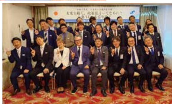
講師の方と集合写真