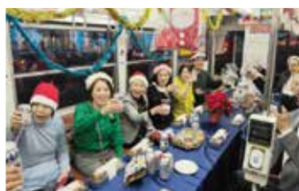
みんなでかんぱ〜い!