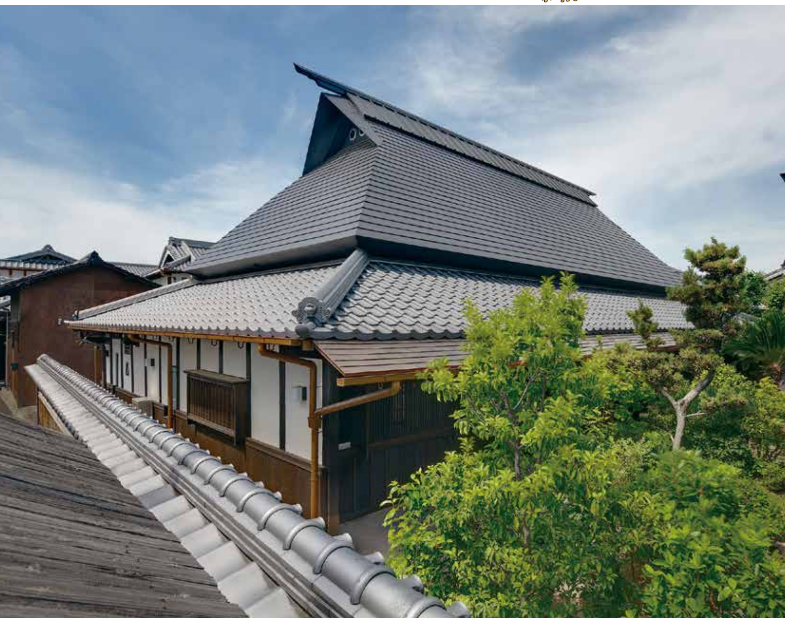
庄屋屋敷の趣を今に残す辻本家住宅(詳細はP7)