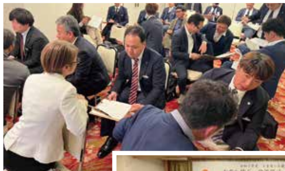
白熱! 政策提言について グループワーク

12月19日(金)、福寿山魚捨にて12月例会「未来を紡ぐ、政策提言ってなあに?」を開催しました。日本YEG政策提言委員会を講師に迎え、グループワークを交えながら、商工会議所における政策提言の重要性や具体的な進め方を学びました。講演では、政策提言が商工会議所の最優先課題の一つであることを再確認し、青年部としても来年度から提言活動に取り組める体制を整えていきたいという意向を共有しました。