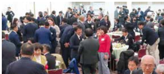
歓談を楽しむ参加者の皆様

乾杯後は、昨年に引き続き食品ロス削減の取り組み「残さず食べよう1010(いちまる いちまる)運動」を実施。参加者の皆様は、和やかな雰囲気の中で食事と交流を楽しみ、輝かしい新年の門出を祝うひとときとなりました。