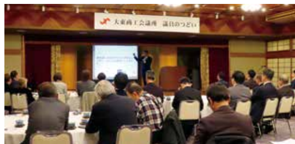
熱心にメモをとる参加された皆さま