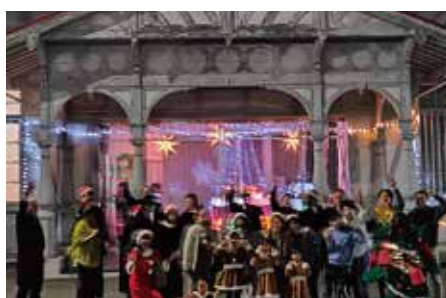
浜寺公園駅旧駅舎前で 記念撮影 (国登録有形文化財)